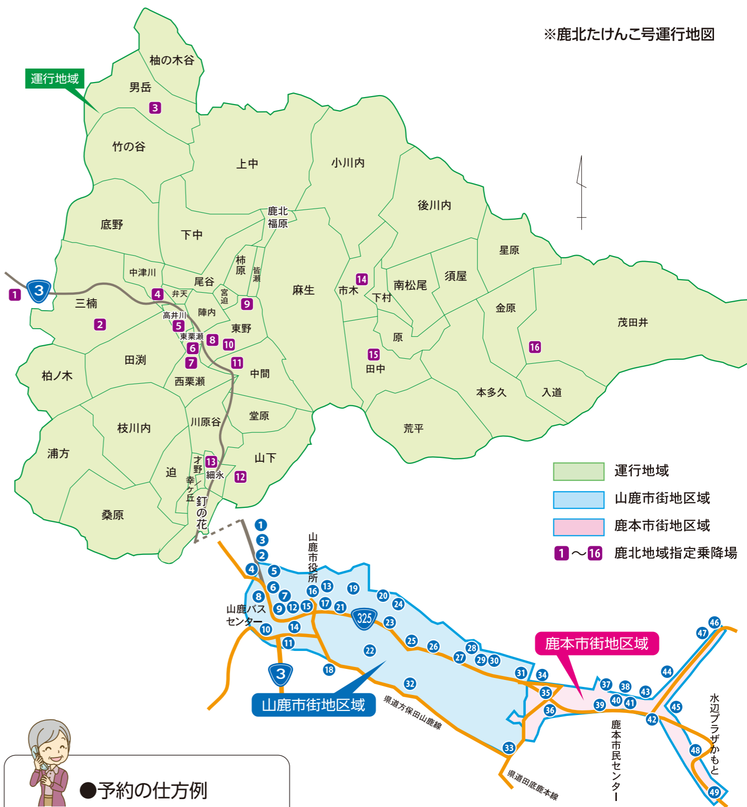
※鹿北たけんこ号運行地図